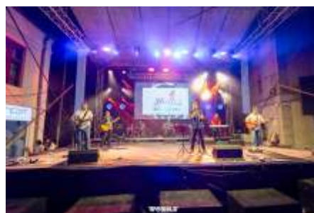
ЕТНО плоштад фестивал 2024