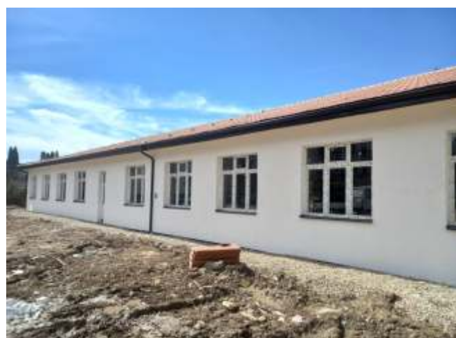
Изградба на првата фаза, од четвртата ламела на Домот за стари лица, во Берово