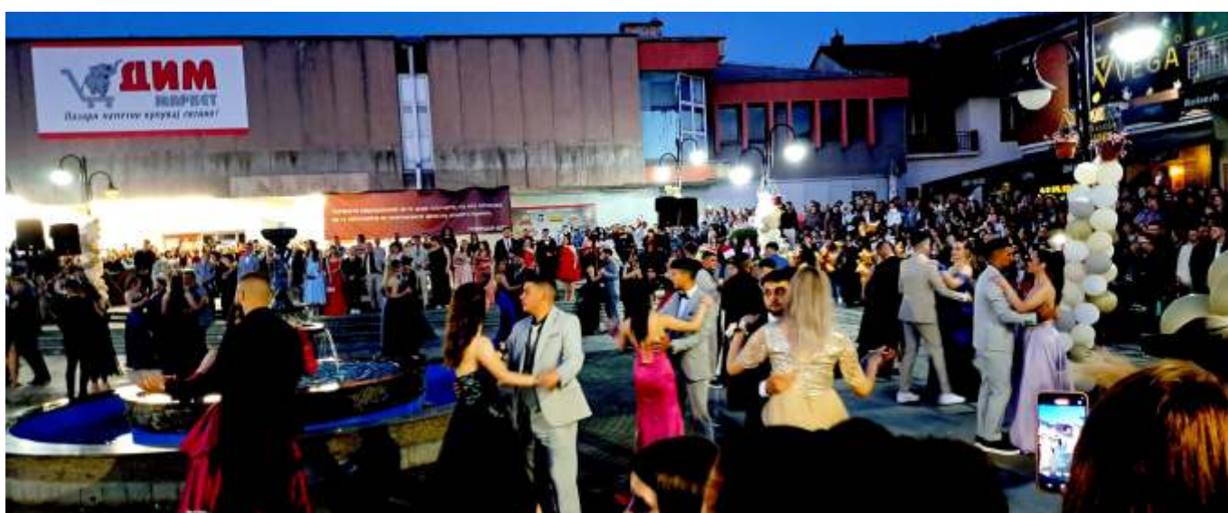
Матурско дефиле 2024