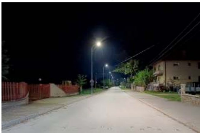
Ново улично осветлување поставено на улица Дамјан Груев