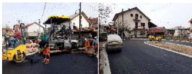
Реконструкција на улица во с. Смојмирово