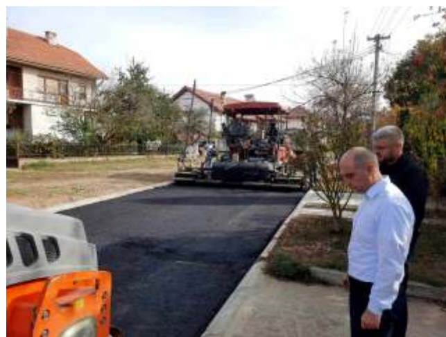
Реконструкција на улица Задарска