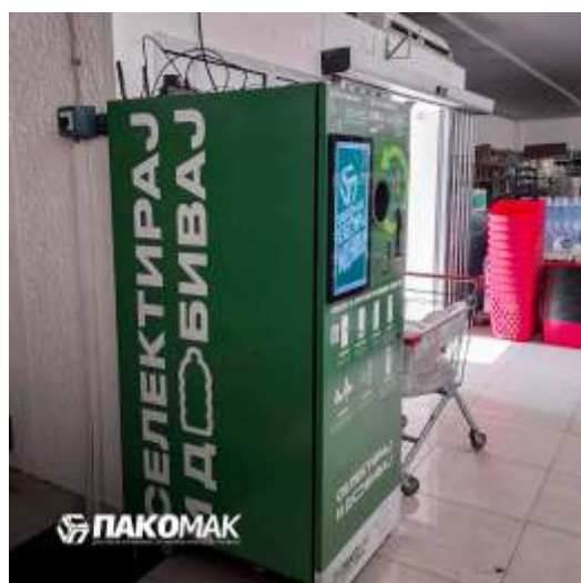
Поставена повратна Вендинг Машина, во маркет ДИМ