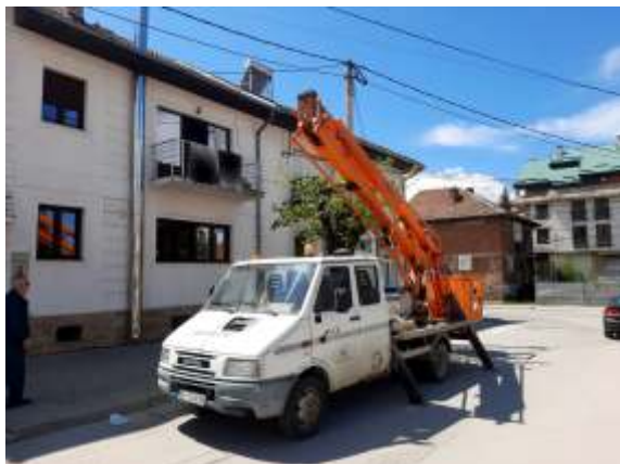
Ново улично осветлување улица Моша Пијаде