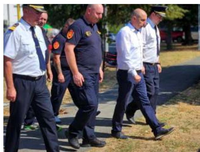
Делегација од Општина Берово, на посета во Врполје, во Република Хрватска