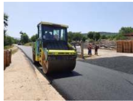
Реконструкција на ул. Димитар Влахов и ул. Партизанска во с. Русиново