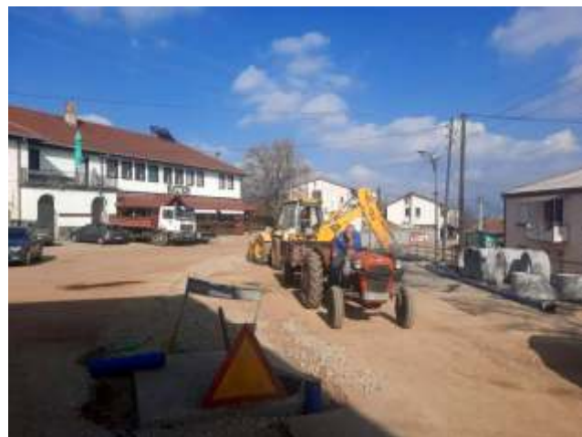
Промена на водоводни цевки во с. Владимирово