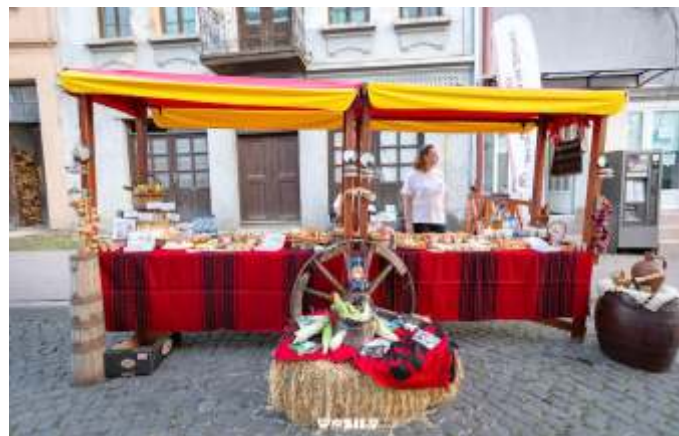
Бадниковата поворка 2024