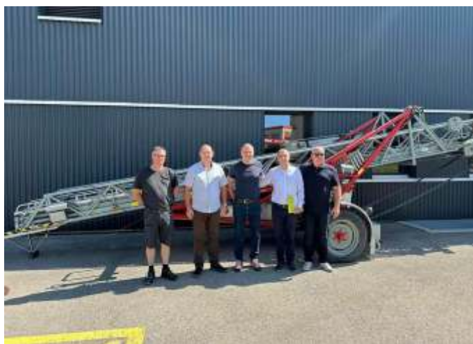
Донација противпожарна скала