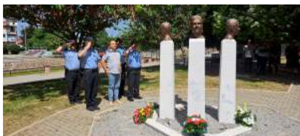
Одбележување на 23 години од смртта на загиналите бранители од Берово во воениот конфликт 2001