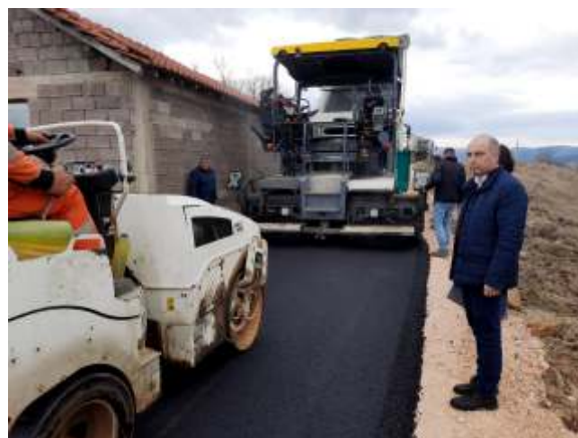
Реконструкција на улица во с. Смојмирово