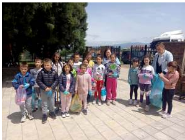
Акција ГЕНЕРАЛКА ВИКЕНД