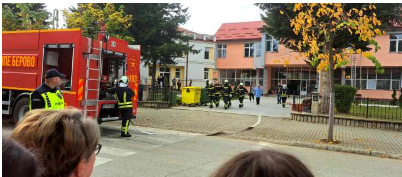
Методско тактичко показна вежба Евакуација и спасување на повредени и загрозени лица од пожар