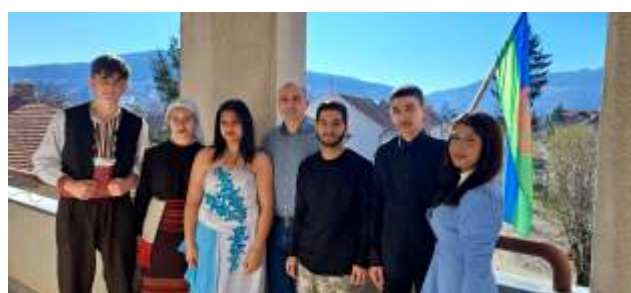
Одбележување на денот на Ромите 8 април