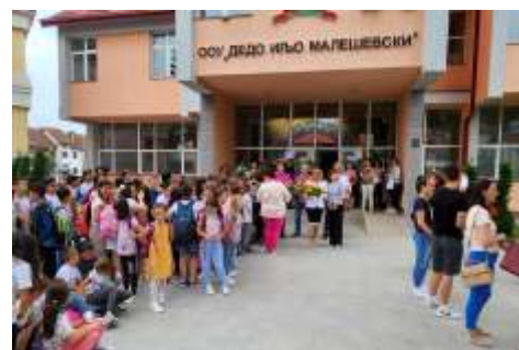
Одбележување на патронен празник ООУ „Дедо Иљо Малешевски“