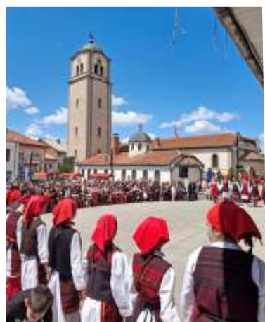
Прослава на Велигден 2024