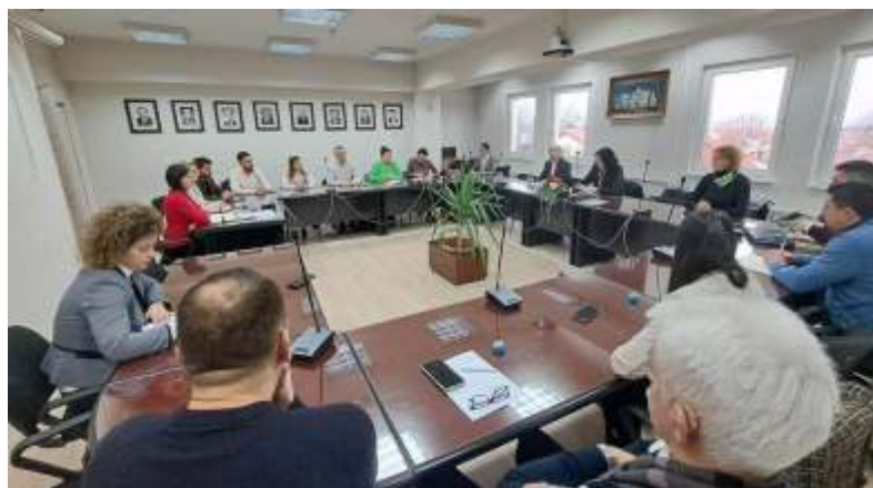
СОВЕТ НА ОПШТИНА БЕРОВО