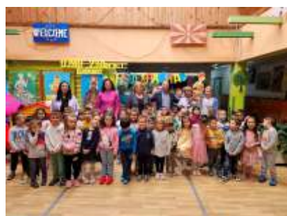
Светска недела на детето