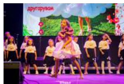
Малешевско ѕвонче 2024