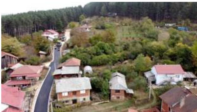
Реконструкција на улица Белградска