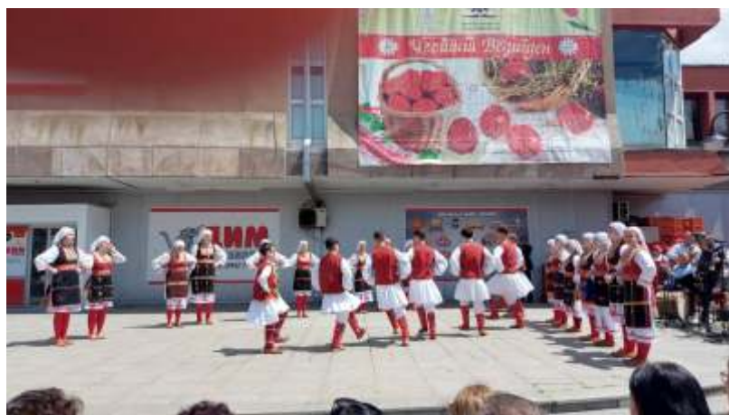
Прослава на Велигден 2024