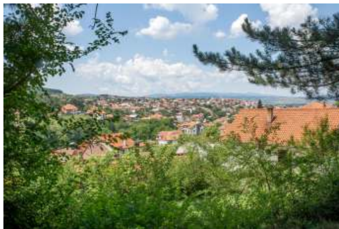
Општина Берово е победник на конкурсот за најеко општина 2023