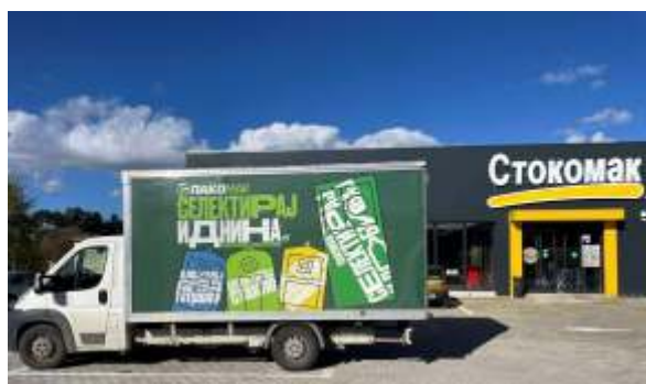
Поставена повратна Вендинг Машина, во СТОКОМАК маркет