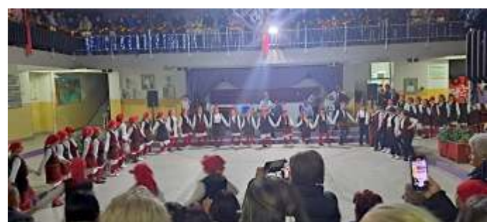
Новогодишен концерт на КУД „Димитар Беровски“