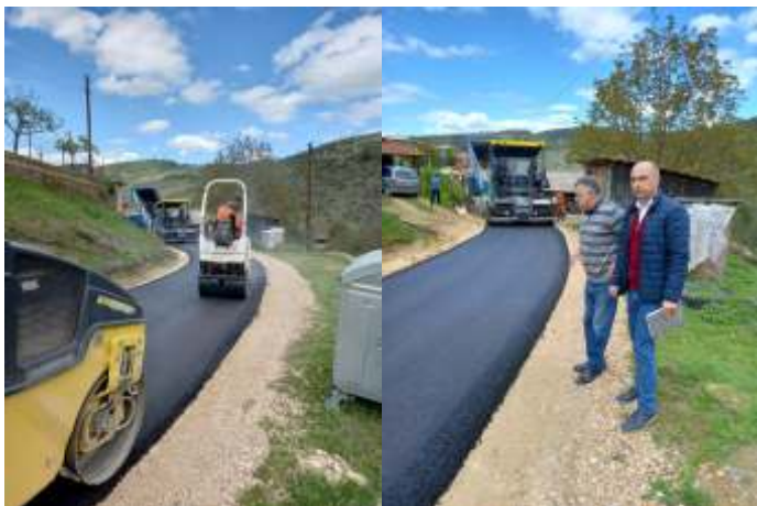
Асфалтирана улица Илинденска во с. Ратево