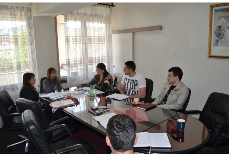
Project management coordinative meetings