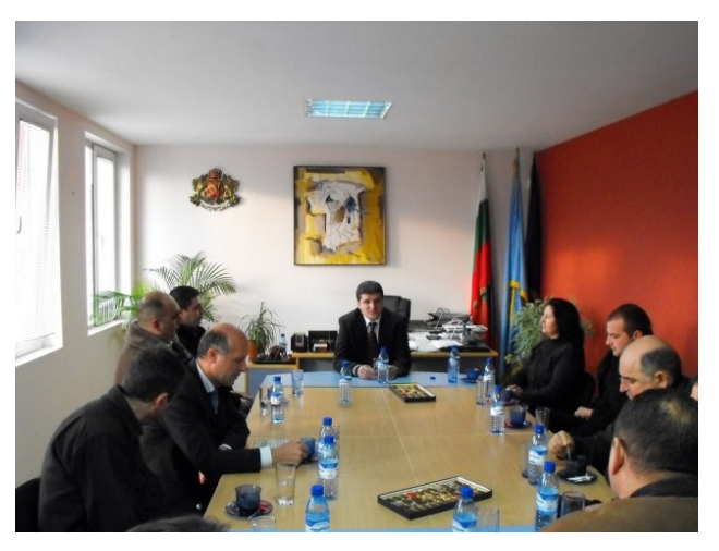
Study Visit in Strumyani