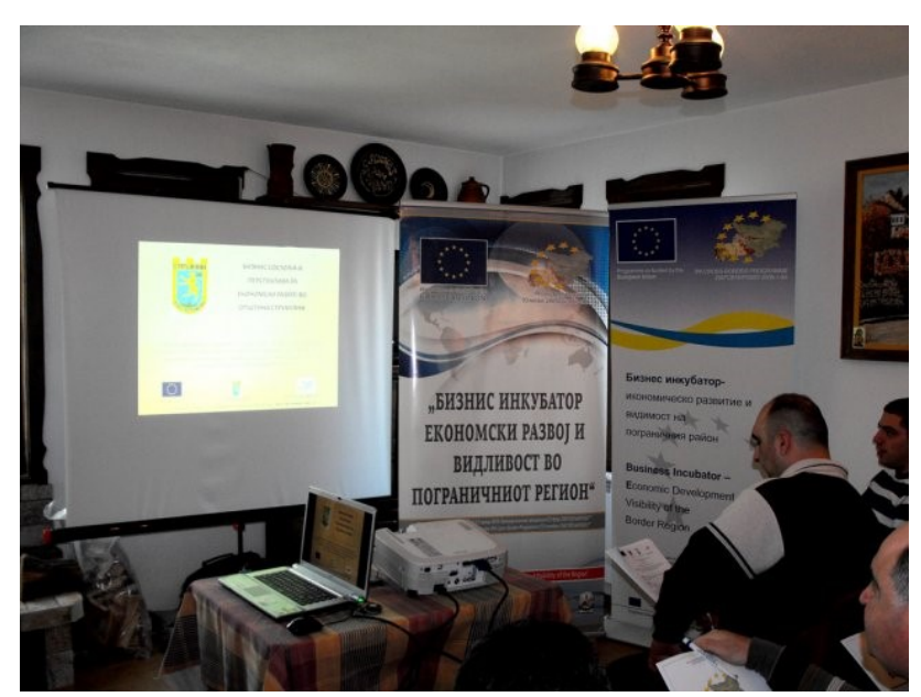
Study Visit in Strumyani