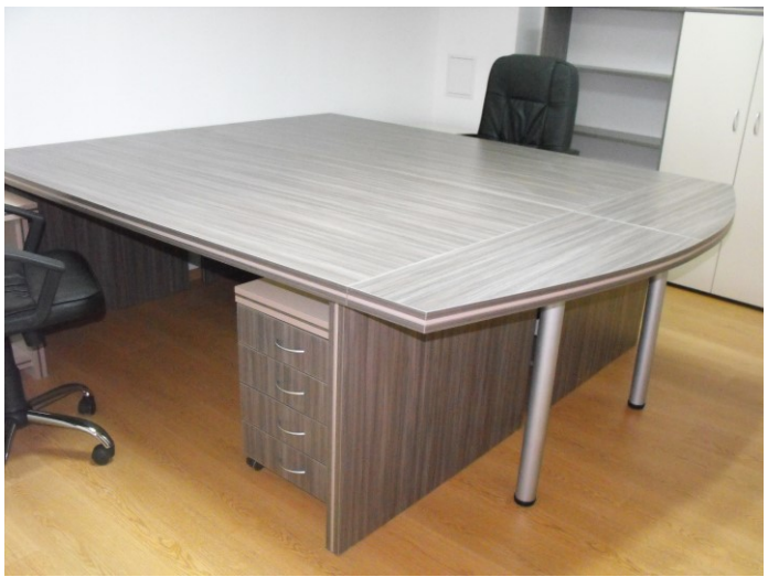
Satellite office of the business Incubator in Strumyani